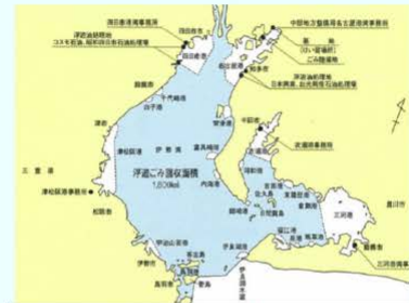
担務海域 伊勢湾・三河湾 (1,800km 2 )