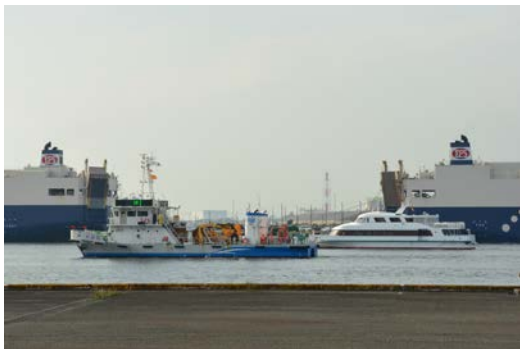
航走拡散訓練の様子

航走拡散訓練は、海洋環境整備船「白龍」と名古屋港管理組合の「ぽーとおぶなごや2」が並走し、航走によるパラキシレンの拡散を行いました。