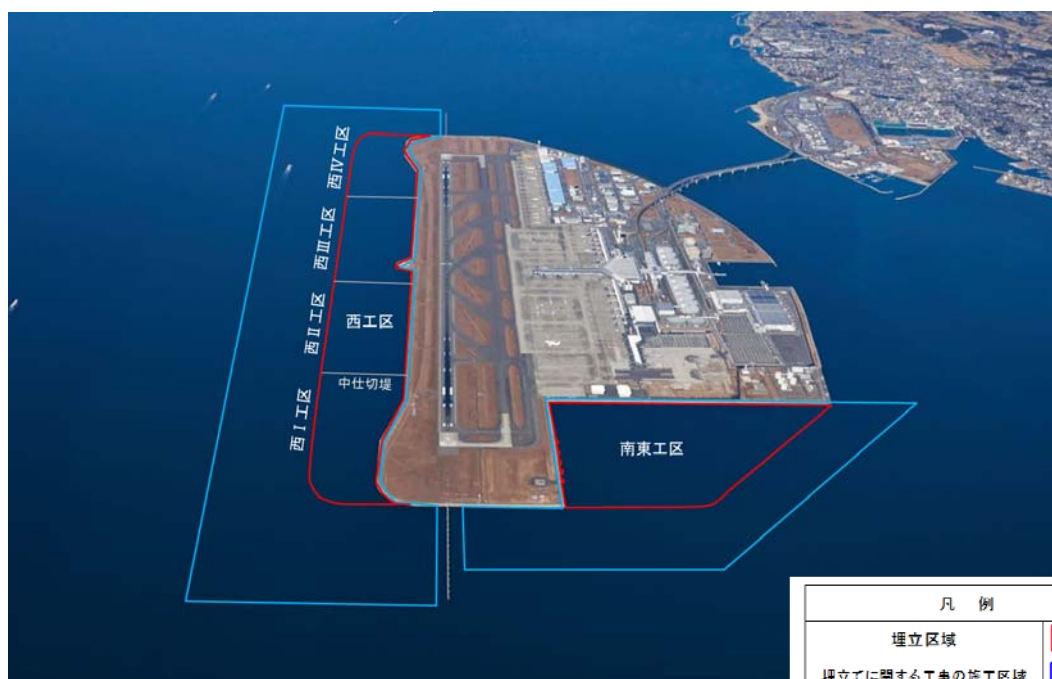
名古屋港新土砂処分場 計画平面図