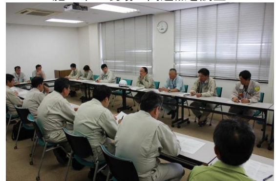
現場の技術的課題等について意見交換