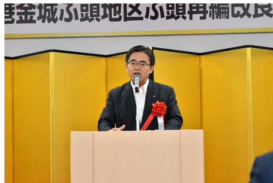
【来賓挨拶】 大村名古屋港管理組合管理者 (愛知県知事)