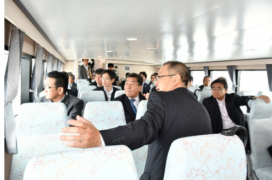
【現地視察】 船内の様子