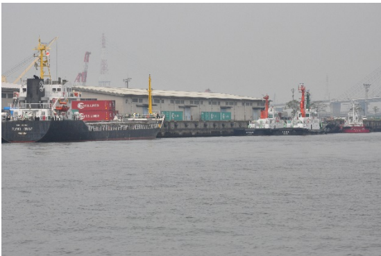
【現地視察】 整備予定地