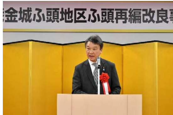
【来賓挨拶】 大野国土交通大臣政務官