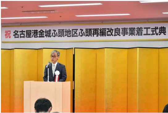
【式辞】 塚原中部地方整備局長