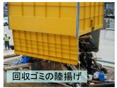
回収ゴミの陸揚げ