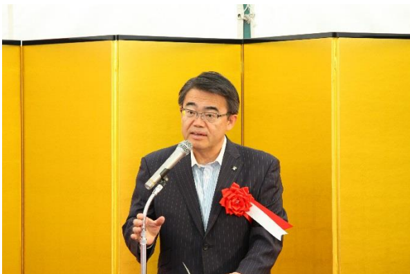
【来賓挨拶】大村名古屋港管理組合管理者 (愛知県知事)