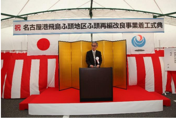
【式辞】塚原中部地方整備局長