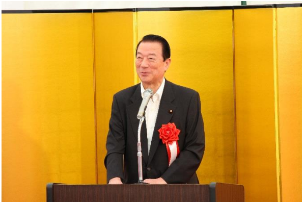
【来賓挨拶】江崎衆議院議員