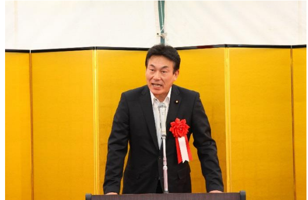
【来賓挨拶】藤川参議院議員