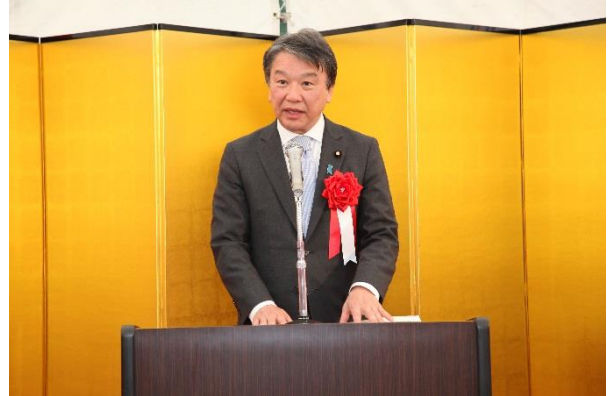
【来賓挨拶】大野国土交通大臣政務官