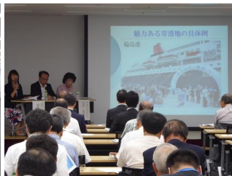
クルーズ船の寄港促進に向けた 名古屋港の魅力づくりシンポジウム(H28.9.10開催)