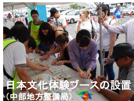
外航クルーズ船社へのポートセールス