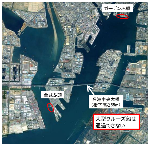
○:クルーズ船着岸場所