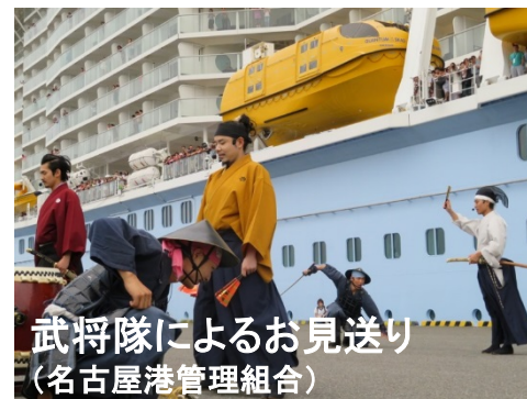
武将隊によるお見送り