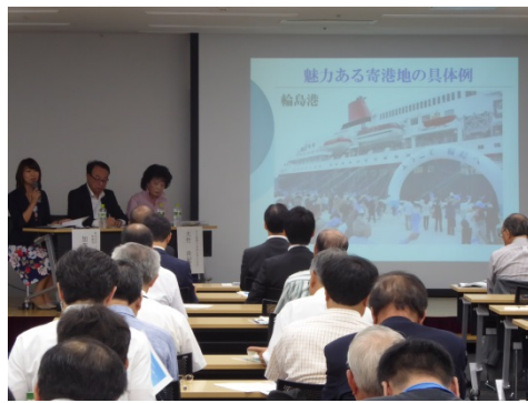
クルーズ船の寄港促進に向けた 名古屋港の魅力づくりシンポジウム(H28.9.10開催)