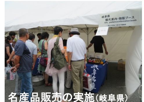
名産品販売の実施(岐阜県)