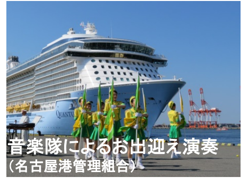
音楽隊によるお出迎え演奏 (名古屋港管理組合)