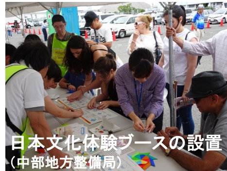
日本文化体験ブースの設置 (中部地方整備局)